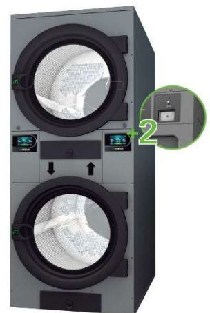
Foto: BÖWE SB2-17-TP2 Trockner

Trommelvolumen: 340 Liter Beladekapazität: 2 x 17 kg Heizleistung: 18 KW Elektrischer Anschluss: 18,67 KW Abmessungen LxBxH mm: 785x989x1694 Gewicht: 180 KG